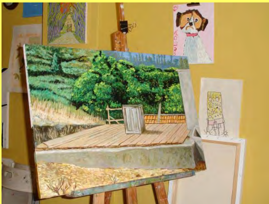
El cuadro lo terminé y vive junto a mis cuadros, bocetos y dibujos. Al igual que las reflexiones, los cuadros siempre siguen vivos.

Por todo ello y dado lo expuesto, tengo la impresión de que vivimos pensando en que tenemos un excedente de agua que no se nos va a acabar nunca. Agua que sí me enseñaron a valorar mis antepasados, a respetar y, por consiguiente, a saber ahorrar. Habría que replantearse, tal vez, la necesidad de volver a desempolvar la cultura de reutilizar y reciclar para un mayor y mejor “desarrollo sostenible”. Tal vez reutilizar y rescatar estas construcciones que, antaño, formaron parte de una cultura popular de abastecimiento indispensable. Madurar esta idea no va desencaminada. Quizás, la alternativa pase por pretender seguir observando el agua de una manera despreocupada e irresponsable y ver si la tierra nos la regala embotellada y en recipientes de diseño, o bien cayendo desde el cielo como por arte de magia. ¡Ay, si mi abuelo levantara la cabeza...!