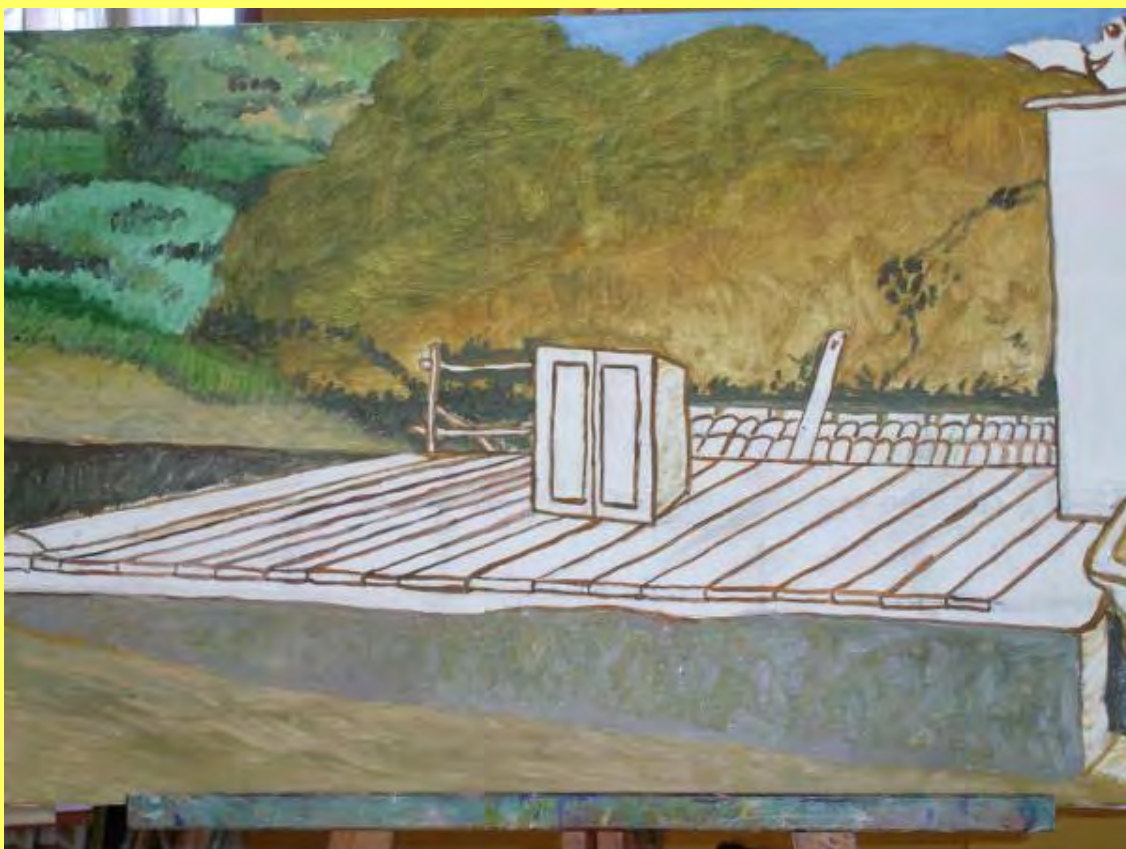
Comencé a darle forma al cuadro. El lápiz grueso daba paso a trazos de influencia impresionista.

Por ello, no me queda más remedio que echar la vista atrás y ensalzar el aljibe que, con sus manos, construyó mi abuelo en tiempos pretéritos. Es un legado de mis antepasados con su cultura tradicional de subsistencia.