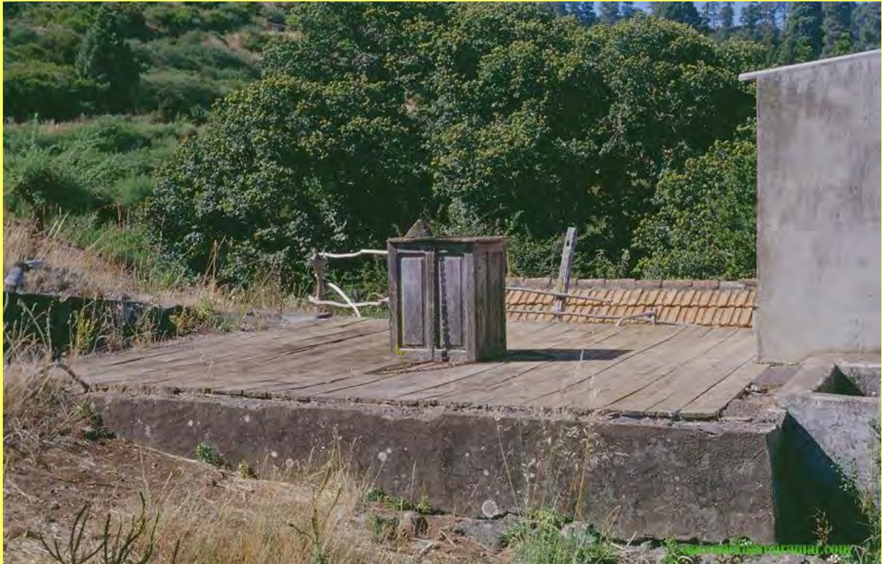
Una fotografía me invitó a la reflexión... Era un viejo aljibe o depósito para almacenar agua junto a una casa.

L eo en una revista de tirada semanal, de un conocido diario, que el agua será en un futuro cercano el “oro azul”, por contraposición a lo que ha sido el “oro negro”. Otros la llaman el petróleo del S.XXI. Y sin embargo, sin el oro azul, no se hubiera podido obtener el tan deseado oro negro.